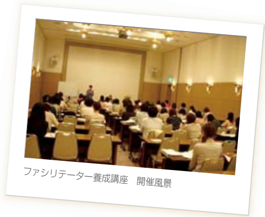
ファシリテーター養成講座 開催風景

入り口講座開催：沖縄、札幌、名古屋、福岡 ファシリテーター養成講座開催：東京(7月、9月、11月)